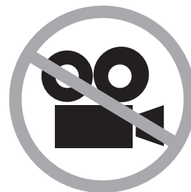
動画撮影禁止 No movie cameras