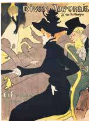
アンリ・ド・トゥールーズ=ロートレック 《ディヴァン・ジャポネ》1892年

観覧料 一般：1,300(1,040)円 高大生、65歳以上：1,100(880)円