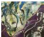
野見山暁作《重い時間》2009年、当館蔵

開館以来、寄贈によって当館のコレクションに加わった作品は800点あまり。寄贈者の皆様への感謝をこめて、その中から代表的な作品を紹介します。