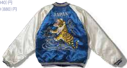
《ROARING TIGER》 1950年代前期、テラー東洋 (東洋エンタープライズ株式会社)蔵

観覧料 一般：1,300(1,040)円 高大生、65歳以上：1,100(880)円