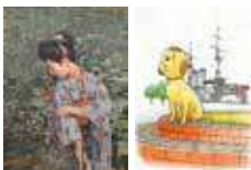
左：矢崎千代二《秋の園》1900年、当館蔵 右：小田扉『横須賀こずえ』(第1巻表紙絵原画)、2019年、作家蔵 ©小田扉／小学館

《秋の園》の新収蔵を記念し展示するとともに、所蔵品より生誕150年を迎えた矢崎の優品約30点を一堂に展示します。また、横須賀を舞台にした小田扉の漫画『横須賀こずえ』(小学館)の原画を中心に展示します。