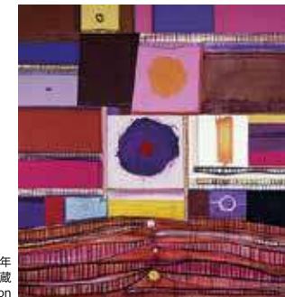
猪熊弦一郎《角と丸BX》1977年 丸亀市猪熊弦一郎現代美術館蔵

観覧料 一般：1,300(1,040)円 高大生、65歳以上：1,100(880)円