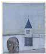
清宮質文《雨後の貯水池》1966年、当館蔵

清宮質文は木版画のほか、モノタイプ、水彩画、ガラス絵も手がけました。もともと摺りの枚数が少なく、同じ版から摺りの異なる作品を何通りも制作するため、ほとんど一点制作のような作品が少なくありません。静謐な詩情をたたえる清宮質文の世界を館蔵作品により紹介します。