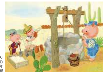
《『さんびきのこぶたのものがたり ぶーぶーうー』原画》 1960年 NPO法人古き良き文化を継承する会蔵