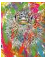
井上文太《おこりん坊 ハリセンボン 激おこぶん丸》2021年、作家蔵

日本画や油絵をはじめとし、NHK連続人形劇の人形デザインを手がけるなど、幅広い分野で活躍する井上文太。自然環境や生物多様性の保全に注目した作品、当市が発行するパンフレットのための挿絵など、多彩な仕事を紹介します。