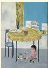
《小さな遊園地》1965年、当館蔵 ©Michiko Taniuchi