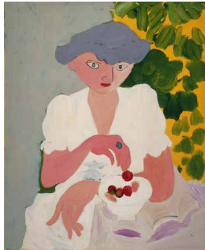
猪熊弦一郎《サクラボン》1939年、丸亀市猪熊弦一郎現代美術館蔵 ©The MIMOCA Foundation