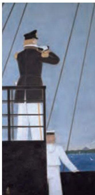
守屋多々志「ヘリー浦賀来航」 1994（平成6）年