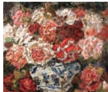
朝井閑右衛門 「薔薇（嘉靖青花唐子紋中壺）〈絶筆〉」 1983（昭和58）年