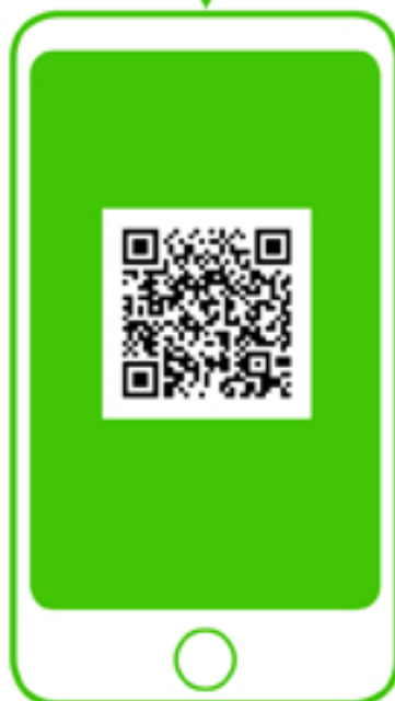
※新型コロナウイルス対策パーソナルサポート 利用時 QRコードから登録