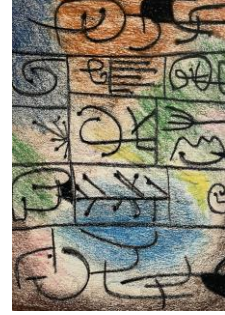
左から芥川紗織ポートレート、スケッチブック、横須賀美術館蔵、《無題》オイルパステル・紙、 NUKAGA GALLERY 蔵、《無題》オイルパステル・紙、NUKAGA GALLERY 蔵