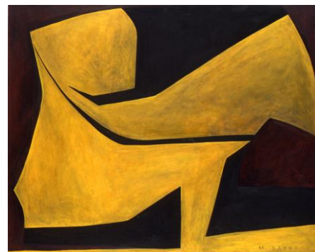
左：《神話より4（民話より天かける）》1956年、染色・布、横須賀美術館蔵、中央：《女XII》1955年、染色・布、NUKAGA GALLERY蔵、右：《スフィンクス》1964年、油彩・キャンパス、横須賀美術館蔵